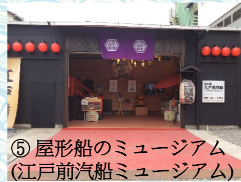
⑤ 屋形船のミュージアム (江戸前汽船ミュージアム)

関東大震災(大正12年)により多くの被害が江東区にもおよび、区画整理により現在の江東区の形となってきました。最近併設されたこのミュージアムでは、屋形船の歴史を学べるほか、もんじゃ屋形船を体験することが出来ます。もんじゃ好きの方は是非足を運んでみてはいかがでしょうか？