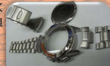
※ポリッシュ・オーバーホール修理