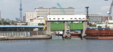
④ スカイツリーをバックに眺める『辰巳水門』

水門を挟んで湾から運河へ東雲と辰巳の間にあるのが辰巳運河で、ここに1962年に設置されたのが辰巳水門です。運河沿いの街を高潮や津波の被害から守るのが役目です。台風などの自然災害時、水門閉鎖時に内部の水をポンプで強制的に排水する施設が水門とセットで必要になるため、辰巳水門には辰巳排水機場(昭和39年設置)が隣接しています。