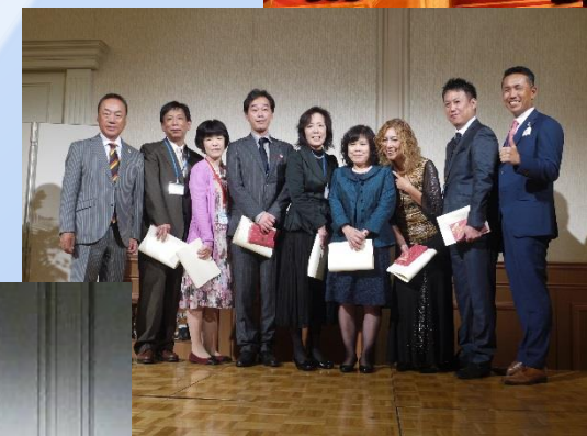
勤続30年の社員です!