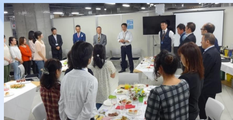
新砂センター懇親会風景