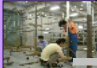
センター長自ら組立ってます!

天井が高いので、検品をする時は少し暗いんです...そこで!検品専用、こんな作業台作っちゃいました!蛍光灯が作業台の一つ一つに付いている、その名も...!?