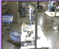
移動式ライト付き作業台♪ ...もう、何でしょね。そのままじゃね?的なww

天井が高いので、検品をする時は少し暗いんです...そこで!検品専用、こんな作業台作っちゃいました!蛍光灯が作業台の一つ一つに付いている、その名も...!?