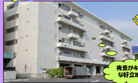
夜景がキレイな好立地★

5月より、約1200坪の規模で江戸川区臨海町のトラックターミナル内に、スタートしました。現在は6階建ての1-3-5階部分を使用しております。南北に大きな窓があり、電気がついていなくても明るく、節電にはいい環境です。夜にはライトアップされた葛西臨海公園の観覧車の明かりがステキです!バス停からも歩いてすぐ!敷地内に食堂もあります。今後さらなる拡大に向けて頑張っております。